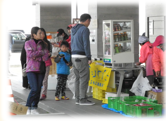
昨年の秋に実施されたダムカフェ・物販の様子