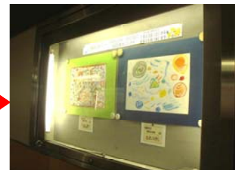
▲過去の地下道内掲示の様子