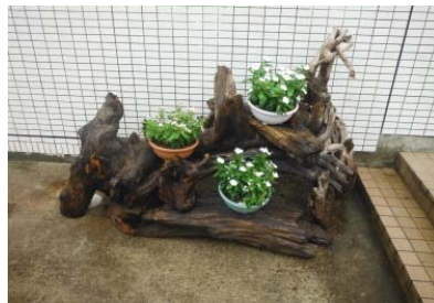
流木アートへの活用事例