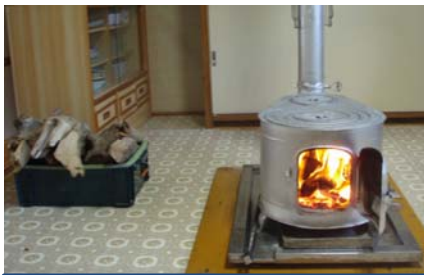
薪ストーブへの活用事例