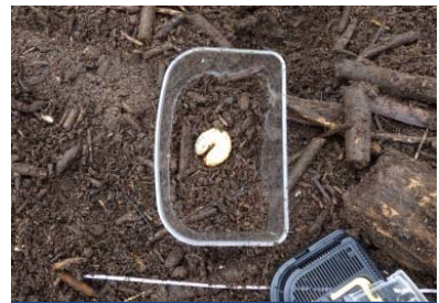
昆虫飼育への活用事例

＜発表記者会：岩手県政記者クラブ、北上記者クラブ、秋田県政記者会、横手記者会、秋田魁新報社大曲・湯沢支局＞