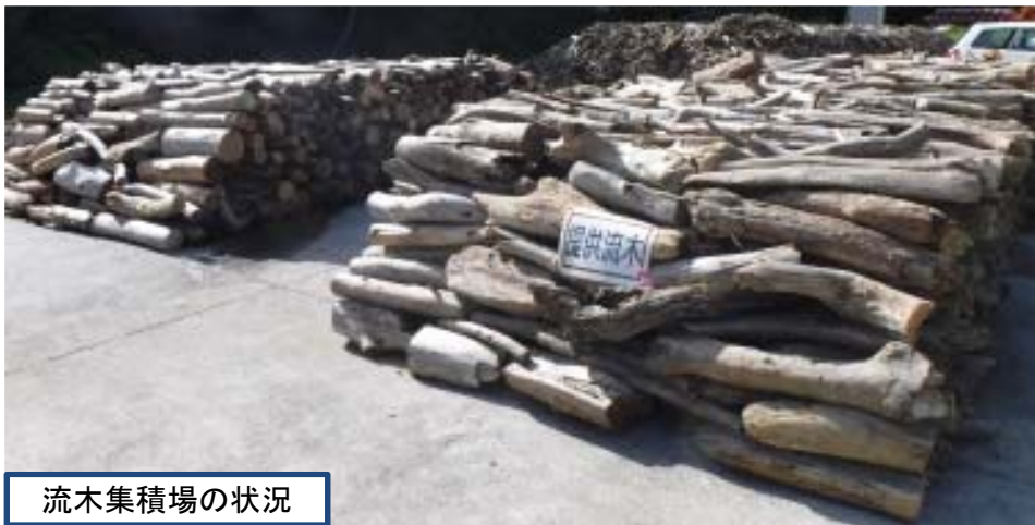
流木集積場の状況

無償提供は、8月1日(火)～8月31日(木)までの31日間で、先着順とし、無くなり 次第終了となりますので、ご了承ください。(詳細は【別添資料】をご覧ください)