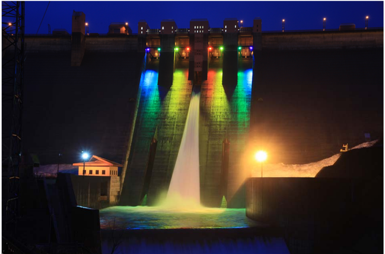
浅瀬石川ダムのライトアップ

浅瀬石川ダムのライトアップカラーは、毎回好評であり王道の レインボーカラー の 一本勝負 です。「森と湖に親しむ旬間（7月21日から31日）」の一環としての実施になります。