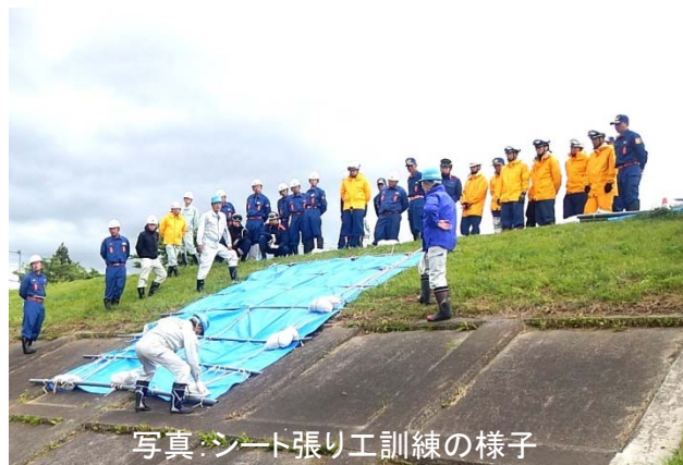
写真: シート張り工訓練の様子