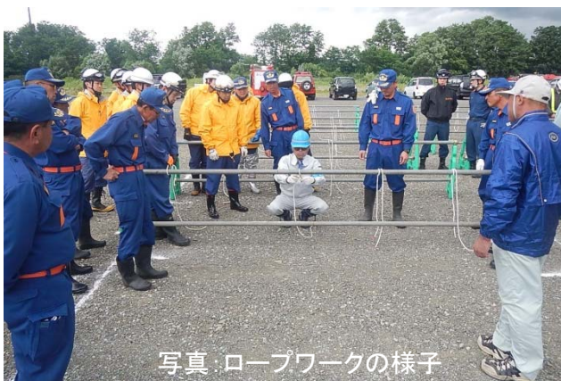
写真: ロープワークの様子