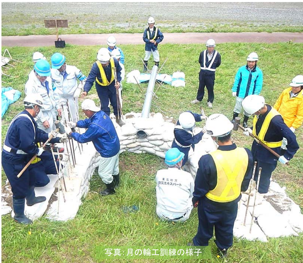
写真: 月の輪工訓練の様子

岩木川水系水防工法訓練(平成28年6月26日) 弘前地区河川防災ステーション河川敷(弘前市大字和田町) で実施