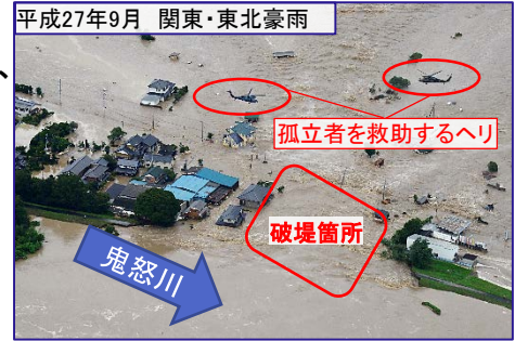
平成27年9月 関東・東北豪雨