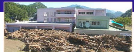
平成28年台風10号により、岩手県の要配慮者利用施設では利用者9名の全員が死亡。