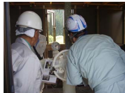
【昨年度点検の様子】

点検は河川管理者(能代河川国道事務所の担当職員)と各施設の水門等水位観測員が合同で点検を行います。