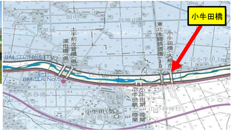
小牛田橋 (江合川:大崎市田尻北小牛田地先～遠田郡美里町南小牛田地先)