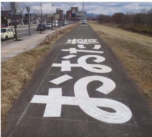
盛岡市太田橋左岸 (盛岡駅前側)