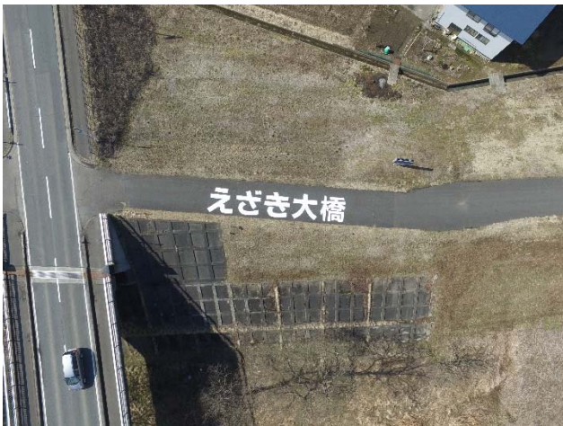
北上川右岸68.4k(金ヶ崎町)