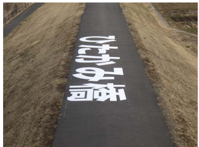
北上川左岸77.2k(北上市)