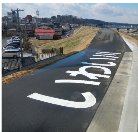
一関市磐井川 (一関第一高等学校付近)