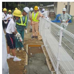
コンクリート打設体験