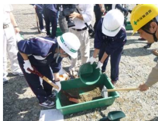
コンクリート製作体験

建設現場で工事完成までに取り組む仕事（工種）の中で、生徒が体験（触れる、驚く、造る、楽しむ）できるものを選んで、実施します。