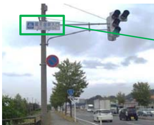
先行実施事例（国土交通省）