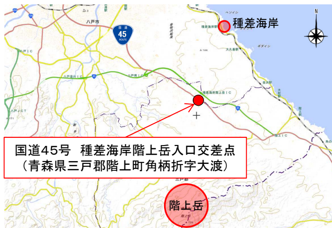
国道45号 種差海岸階上岳入口交差点 (青森県三戸郡階上町角柄折字大渡)