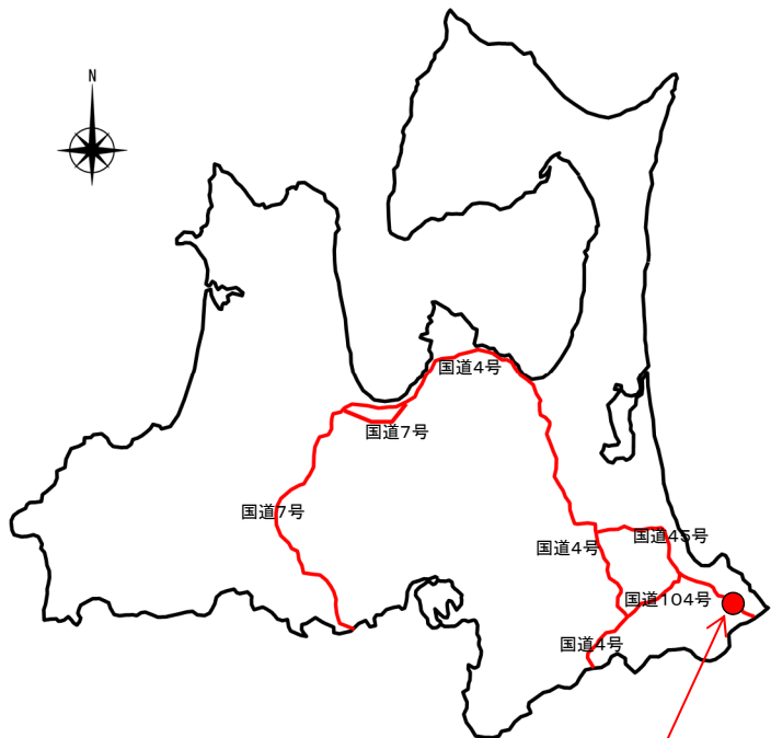
国道45号 種差海岸階上岳入口交差点 (青森県三戸郡階上町大字角柄折字大渡)