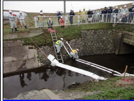
万国旗型・吸着型オイルフェンス設置状況