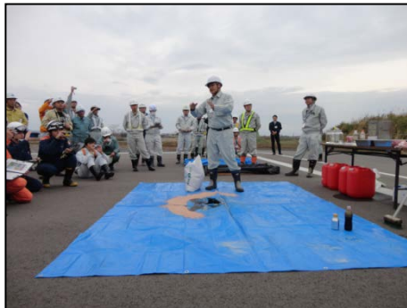
路面における油回収方法

交通事故発生を想定し、路面→側溝→水路→小河川→大河川へと油が拡散してしまうと、回収までに時間と費用がかかることを解説。