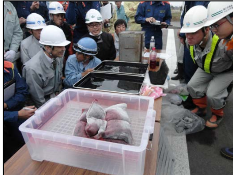
吸着マット性能の実習