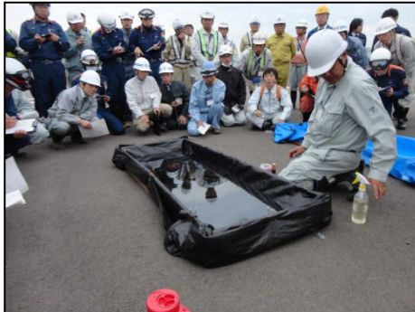
中和剤使用の弊害