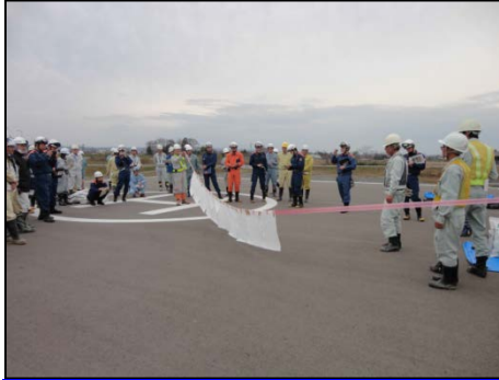
万国旗型オイルフェンス作成状況

水路や小河川での油回収に有効な「万国旗型吸着フェンスの製作・設置」に関する実習を行いました。