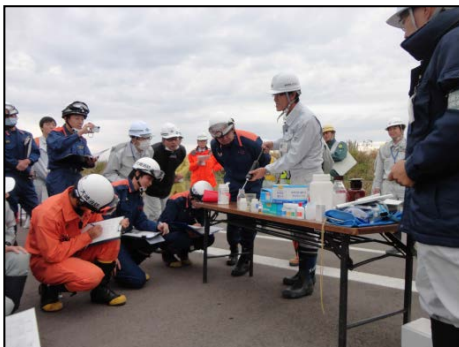
パックテスト等の説明

化学物質・毒物等を対象とした水質事故への対応方法や、PH試験紙、パックテスト、Do(溶存酸素)のキット、トルエン(燃料油系)の計測器について解説。