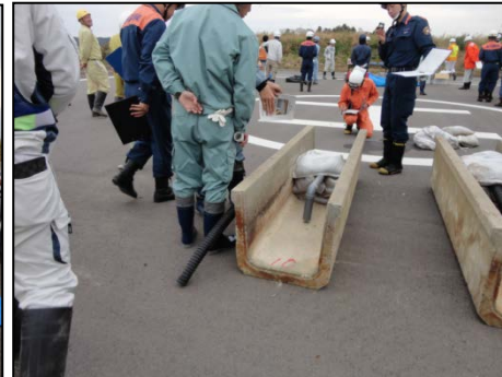
土のう積みによる油回収方法