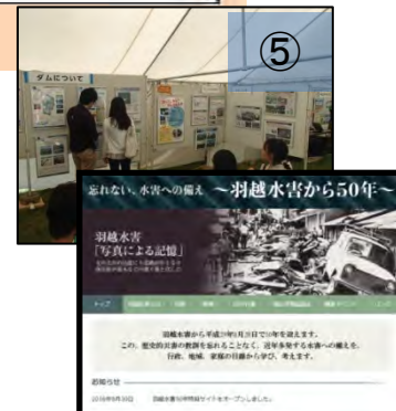
⑤ 羽越水害50年 特設サイト パネル展、映像資料の上映