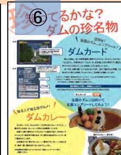
⑥ ダムの紹介コーナー