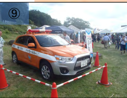
⑨ 河川パトロールカー、遠隔式除草機械の展示。搭乗可。