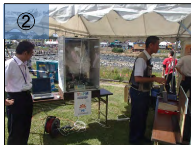
② 雷実験など気象に関する展示