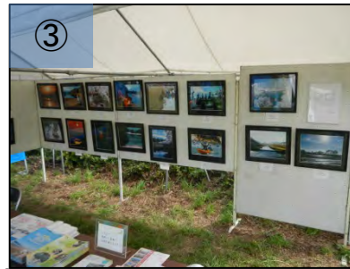
③ 「美しい元気な山形づくり写真コンテスト～次世代に繋ぐ川と人～」入賞作品展示