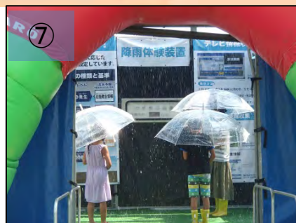
⑦ 最大200mm/hの雨量が体験できる降雨体験