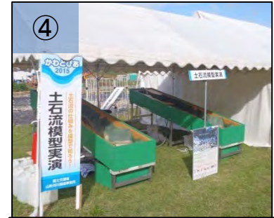
④ 土石流の仕組みがわかる模型の実演