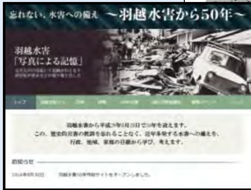
羽越水害50年 特設サイト (PC設置)