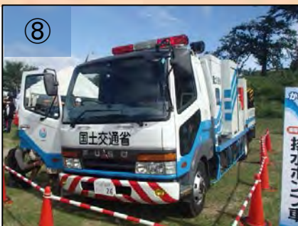
⑧ 30m 3 /mの排水ポンプ車の展示。搭乗可。