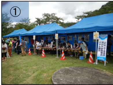
① 河川や砂防に関するパネル等の展示