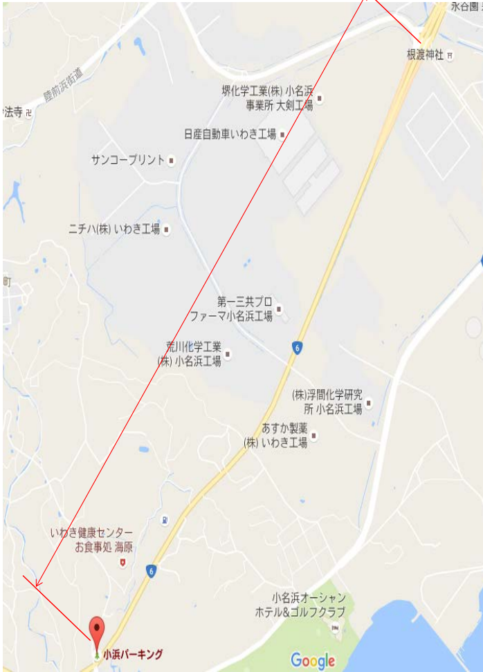
【徒歩点検のルート】