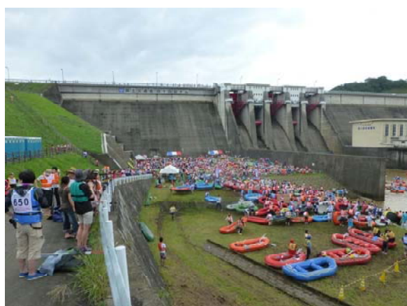
ゴムボート川下り大会出発状況 (H27.7撮影)