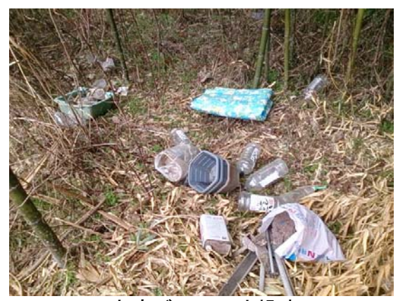
家庭ゴミの不法投棄