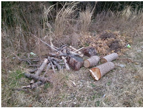
伐採木の不法投棄