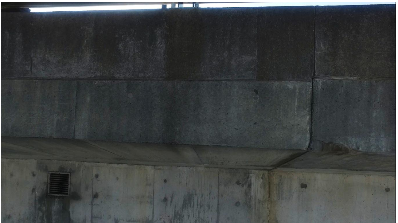
ドローンにより撮影した画像