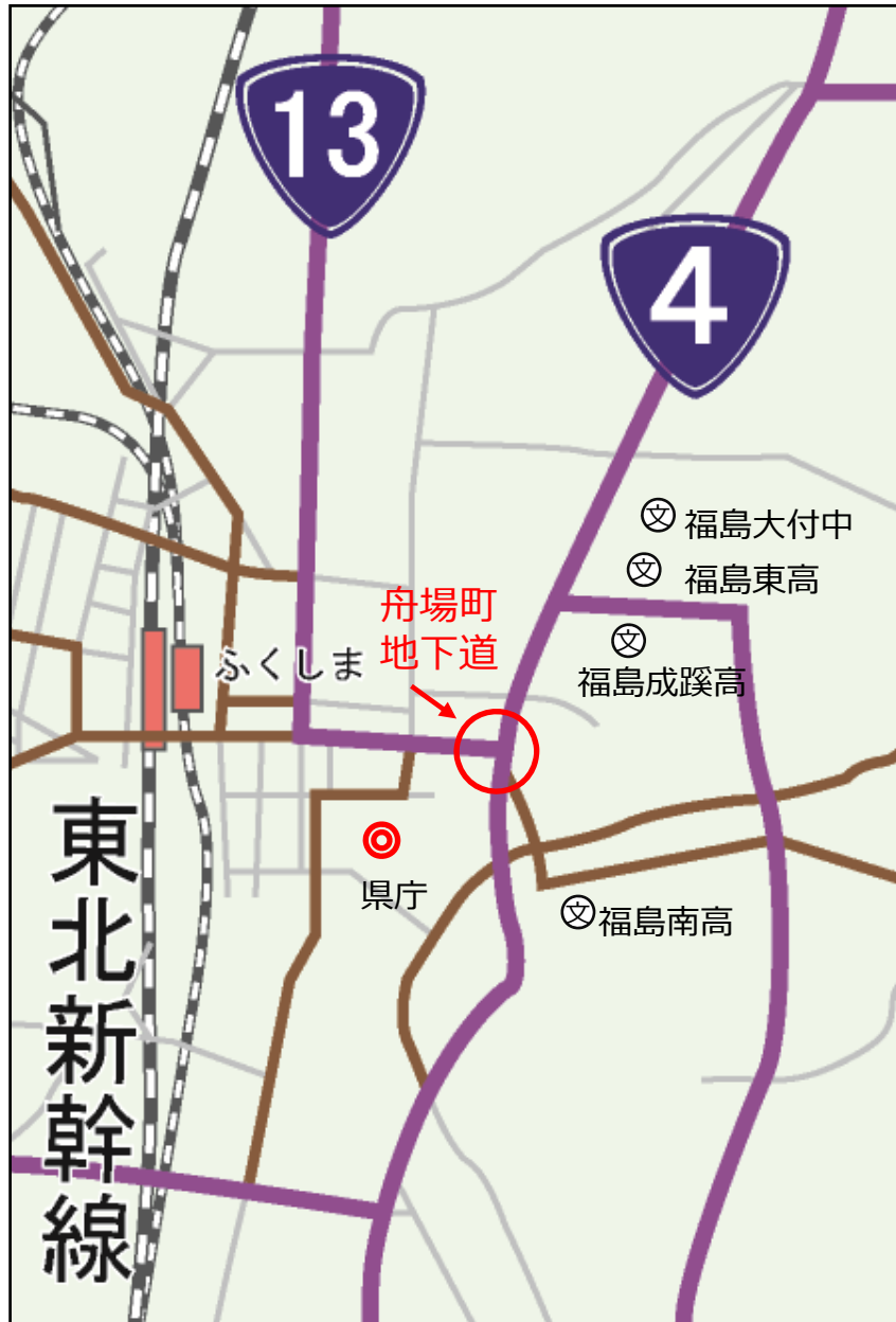
舟場町地下道 平面図