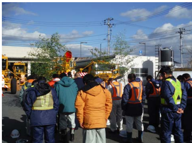
◆「安全祈願祭」の様子