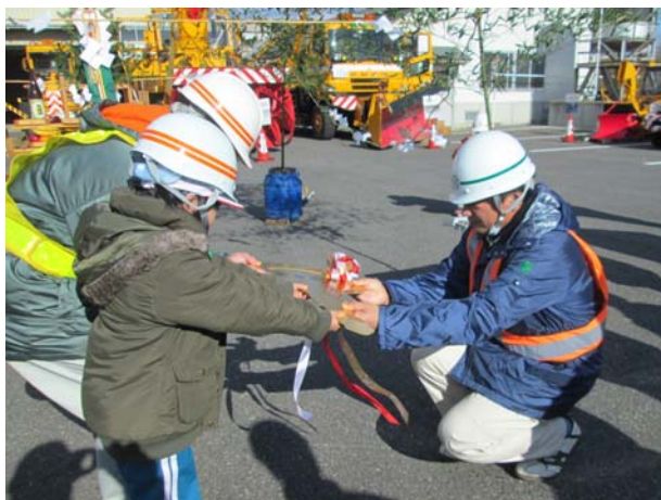
◆「出動式（除雪機械鍵引渡し）」の様子