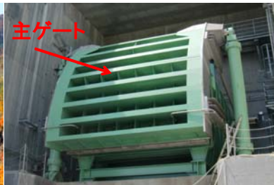
【コンジットゲート】