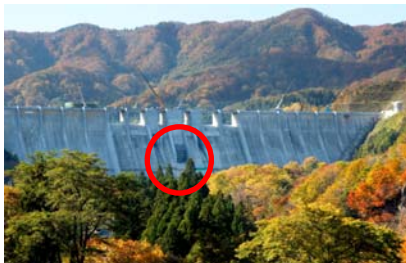
【ダム中央部のコンジットゲート】

また、主ゲート等へも近づくことが容易なため維持管理しやすいという特徴があります。