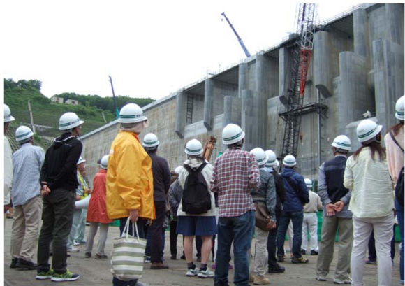
【目屋ダム天端から津軽ダムを見上げて目屋ダムとの高さを感じた参加者】