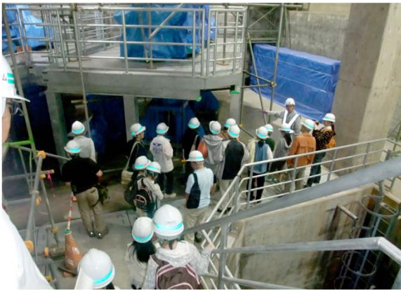
【放流バルブ室内を見学する参加者】