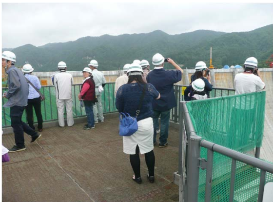
【展望所から新緑に包まれた津軽ダムの全景を眺め説明に耳を傾ける参加者】