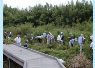
ビオトープの整備