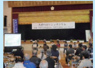
シンポジウムの開催