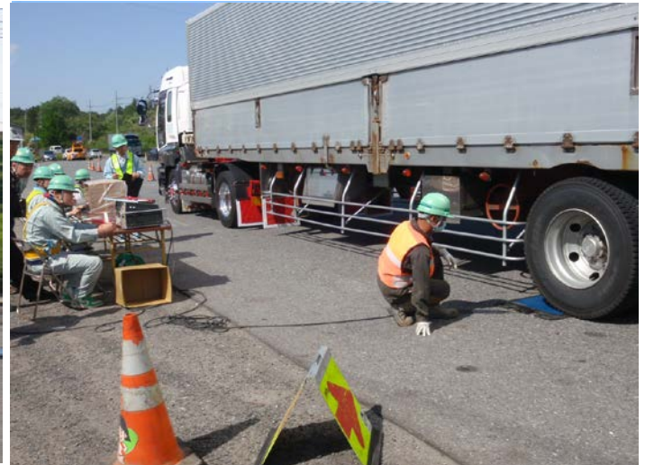
・特殊車両の寸法や重量の測定及び、通行許可証等の確認

〈 発表記者会：宮城県政記者会、東北電力記者クラブ、東北専門記者会、古川記者クラブ 〉