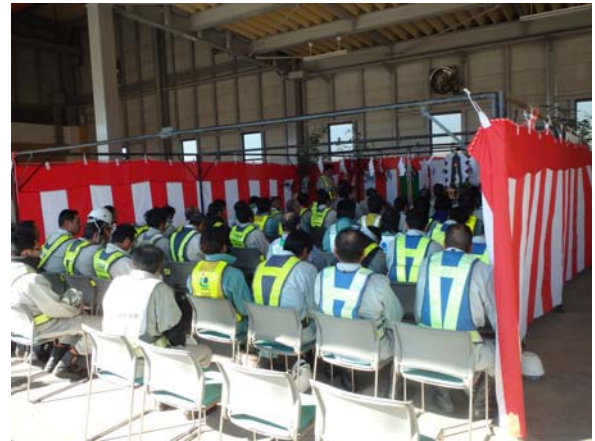
▲職員・作業員約50人が安全を祈願