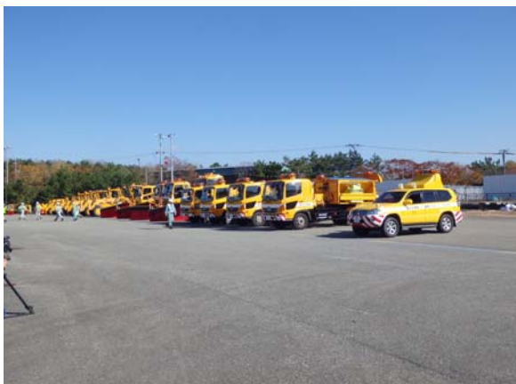
▲除雪機械の点検・乗車