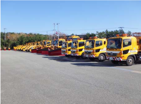
▲国道を除雪する約20台の除雪機械