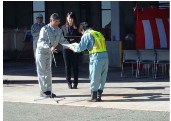
▲除雪功労者の表彰