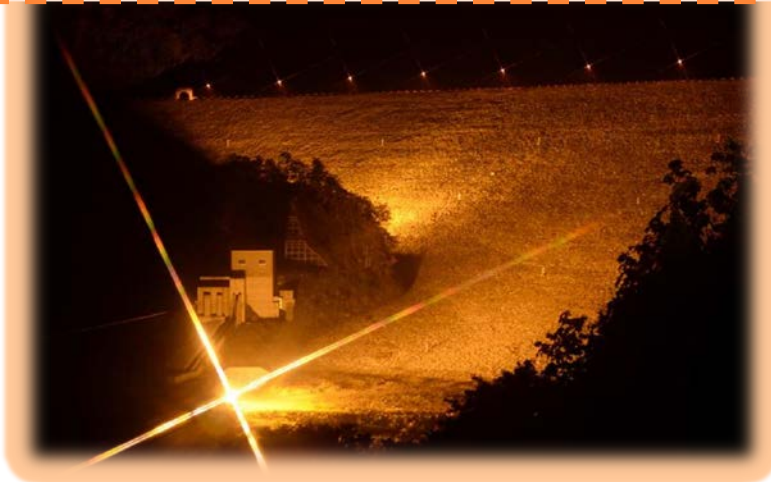
胆沢ダムライトアップの様子（国道397号から撮影）