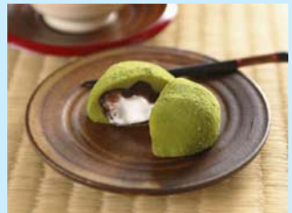
地元名産品「霧の森大福」