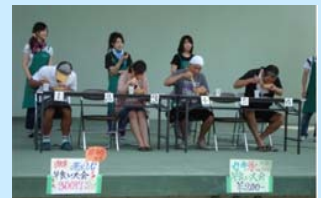
大学生が企画したイベント