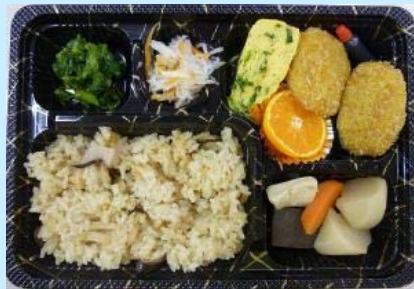
道の駅弁当「かなん冬の恵み」