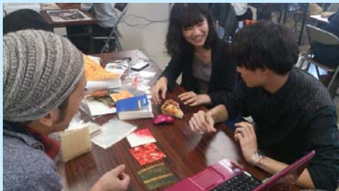
包装デザイン打合せ