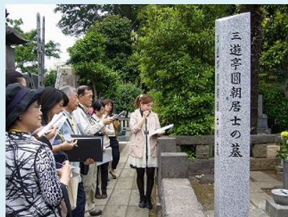
地域巡りガイドの様子