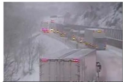
西会津町藤峠付近