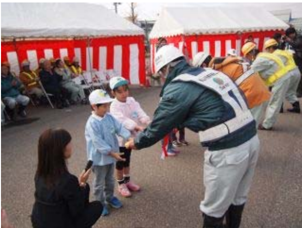
園児による鍵の引き渡し