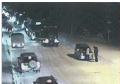
郡山市内中山峠付近