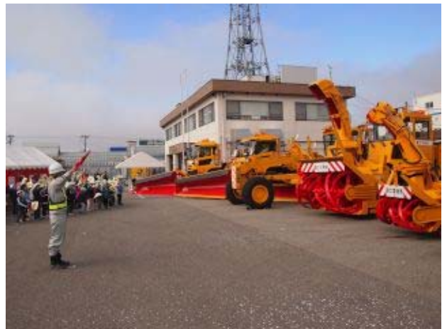
園児による除雪車始動命令