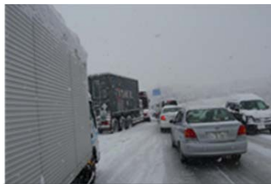
会津若松市強清水付近