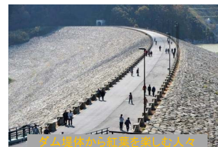
ダム堤体から紅葉を楽しむ人々