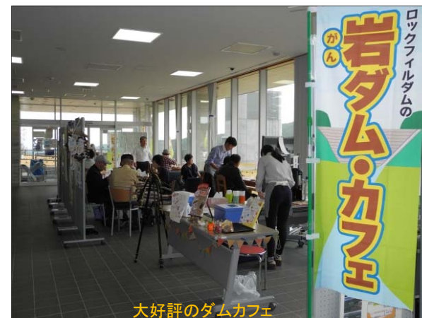
大好評のダムカフェ