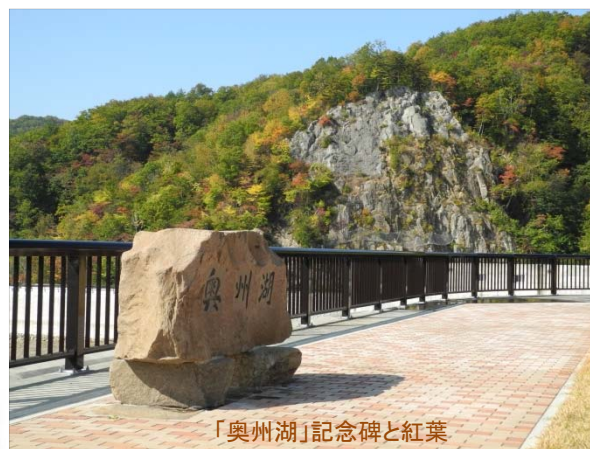
「奥州湖」記念碑と紅葉