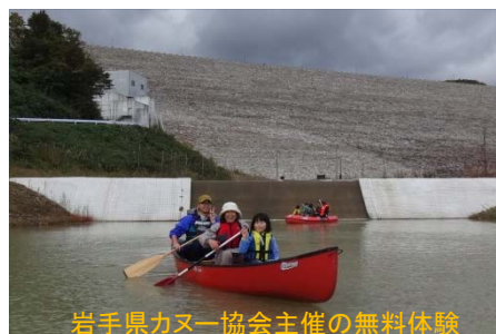
岩手県カヌー協会主催の無料体験