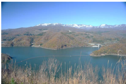
奥州湖眺望台より