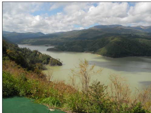
奥州湖眺望台より