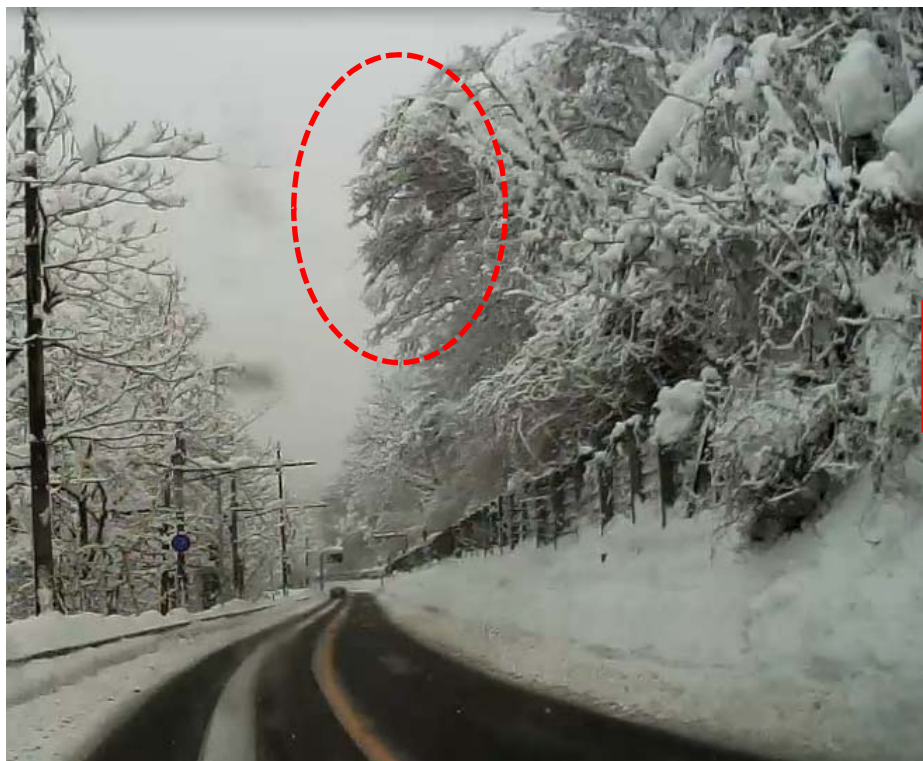
写真一 伐採前の状況 (平成26年12月31日時点)