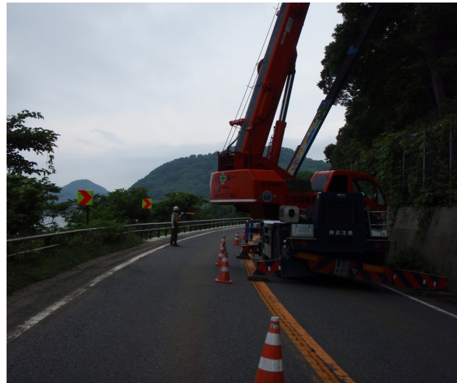
写真一 作業状況【その2】