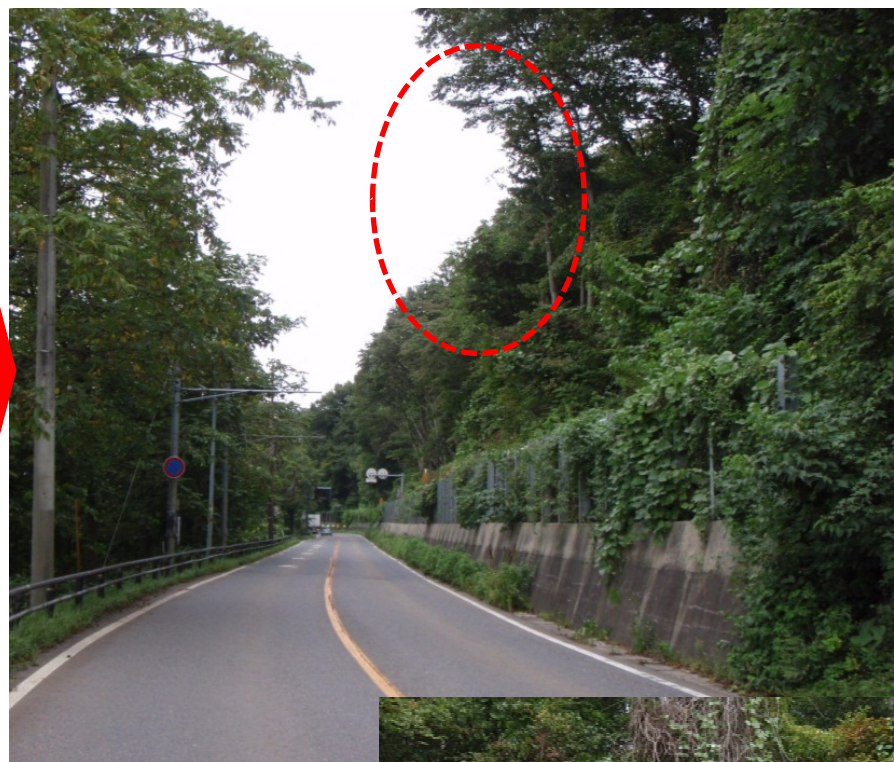
写真一 伐採後の状況 (平成27年9月11日時点)