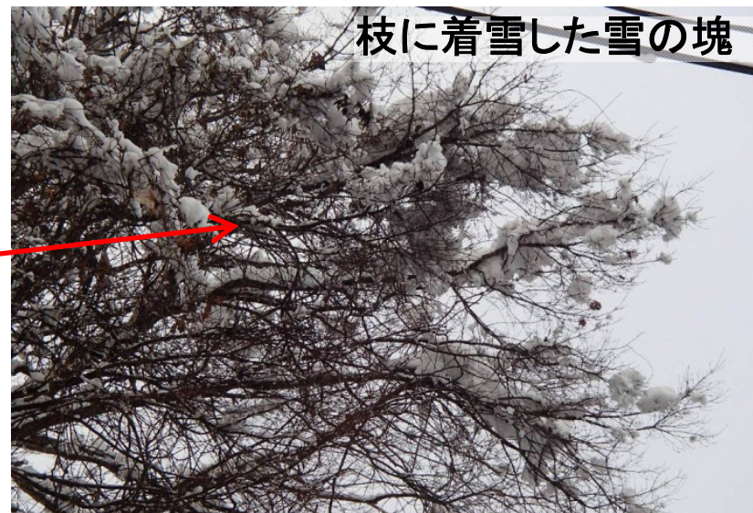
枝に着雪した雪の塊