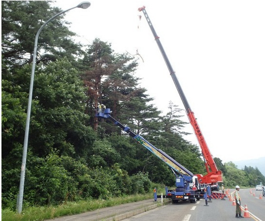
写真一 作業状況【その1】