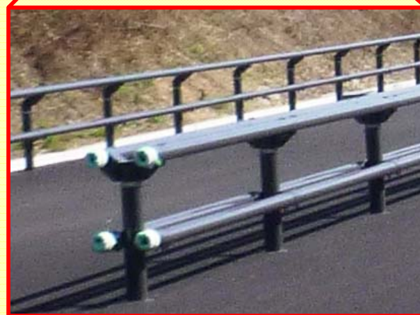
■鋼製ガードパイプによる車線分離