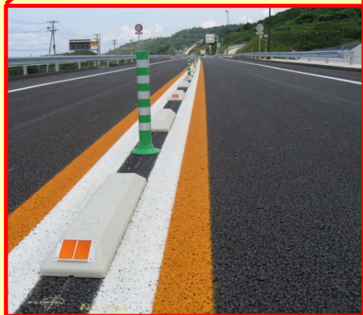
■樹脂ブロックとラバーポールによる車線分離