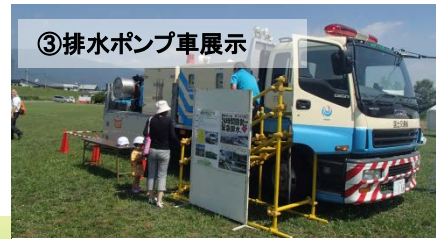
③排水ポンプ車展示