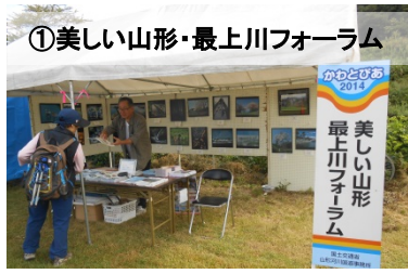
①美しい山形・最上川フォーラム

参加機関： 東北地方整備局 山形河川国道事務所／山形地方气象台／山形県／美しい山形・最上川フォーラム