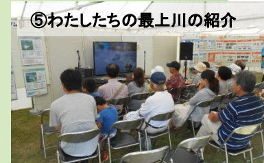
⑤わたしたちの最上川の紹介