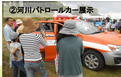
②河川パトロールカー展示