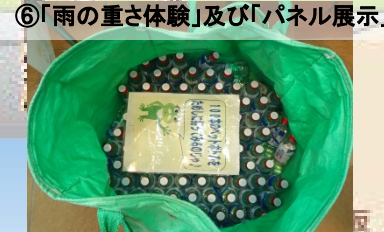
⑥「雨の重さ体験」及び「パネル展示」