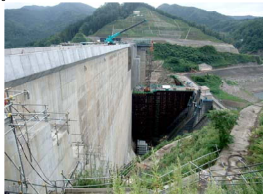
津軽ダム（写真左）と目屋ダム（写真右）