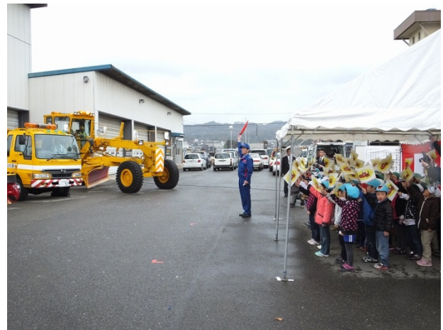
園児による除雪車始動命令