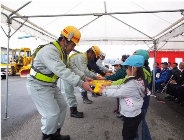
園児による鍵の引き渡し