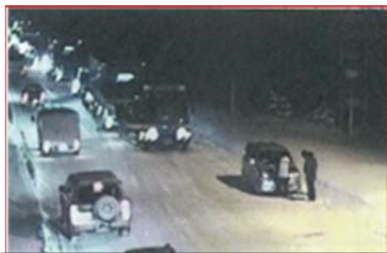
郡山市内中山峠付近