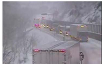
西会津町藤峠付近