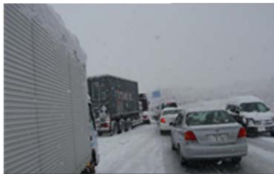
会津若松市強清水付近