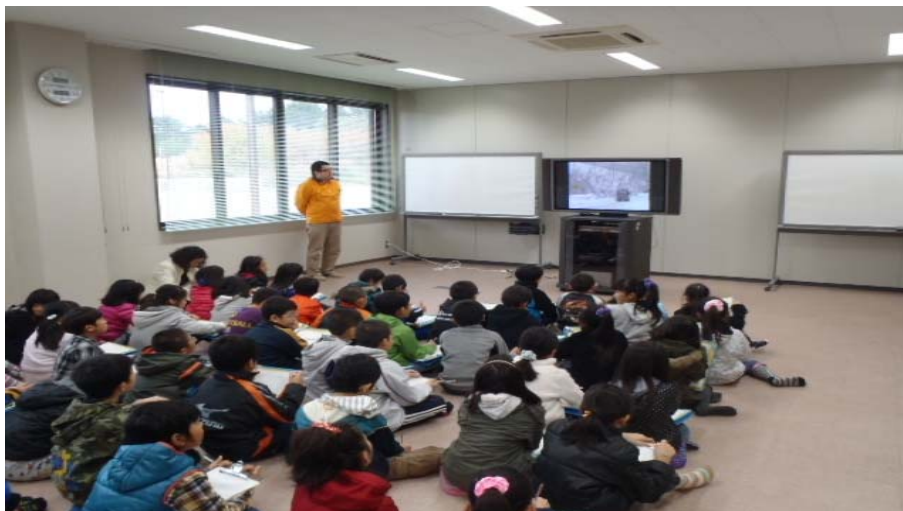
▲除雪機械や作業の説明