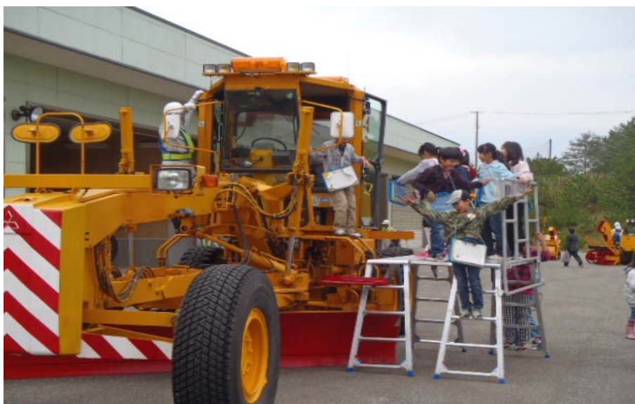
▲除雪機械の乗車体験