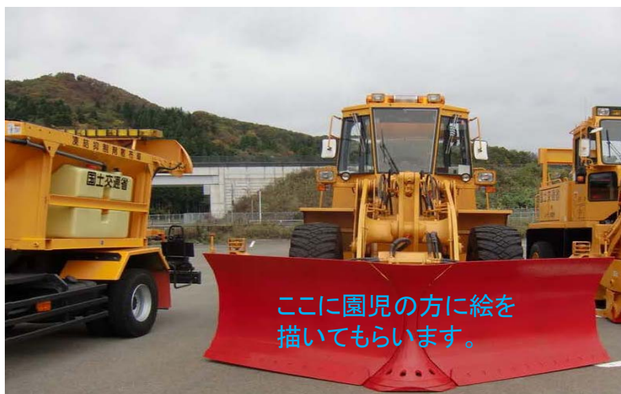
▲除雪機械へお絵かき