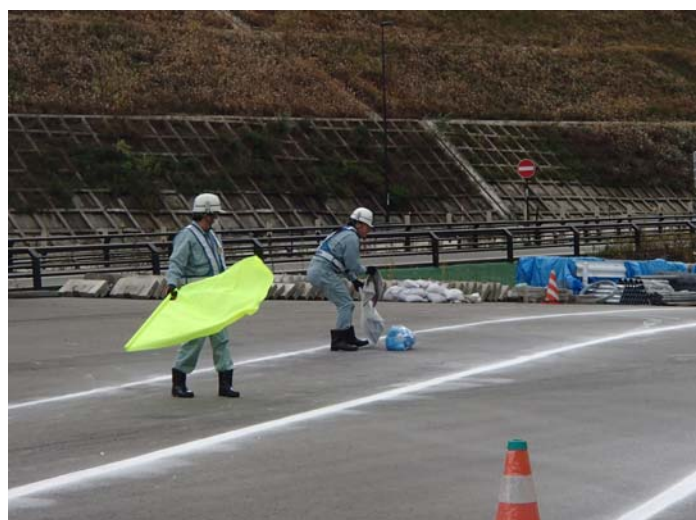
実技訓練状況 (落下物対応)