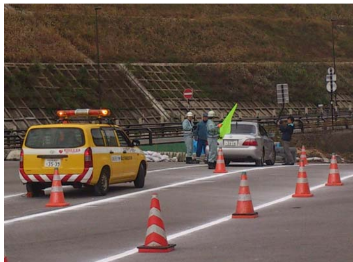
実技訓練状況 (故障車対応)