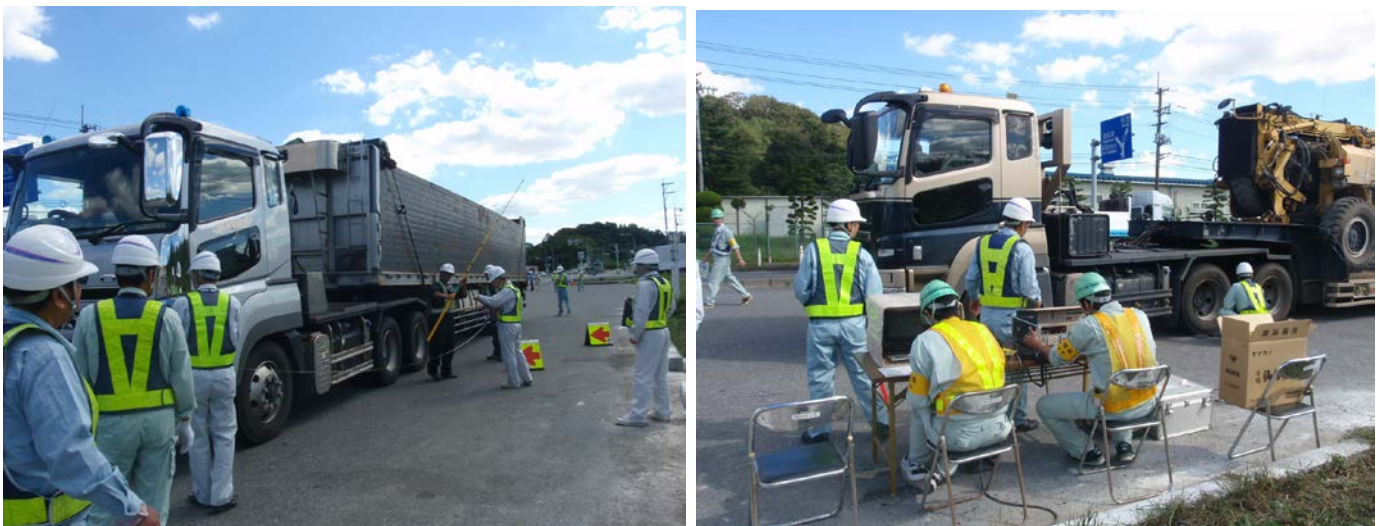
・特殊車両の寸法や重量の測定及び、通行許可証等の確認