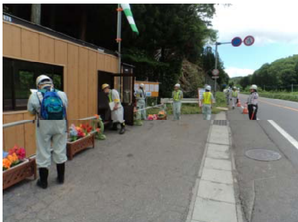
▲パトロールの様子