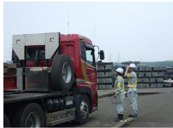
過去の取締りの様子 （浅内車両検測所（能代市））