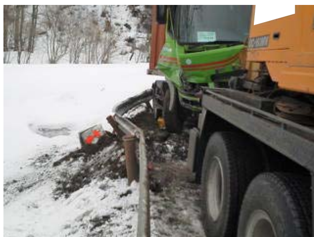
ガードレール等の損傷状況