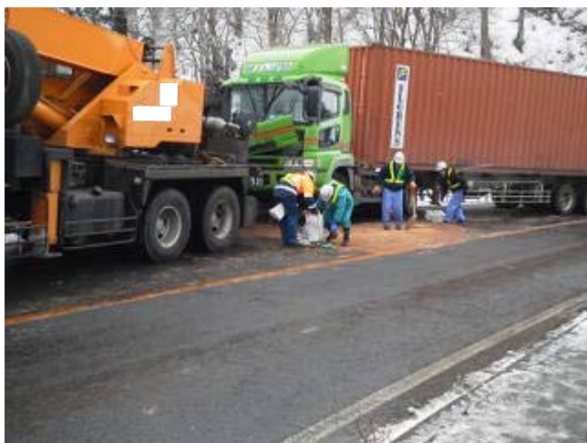
事故車両の撤去状況