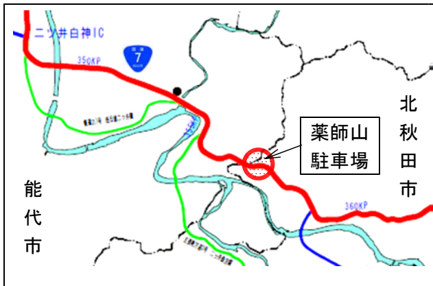
取締り場所位置図