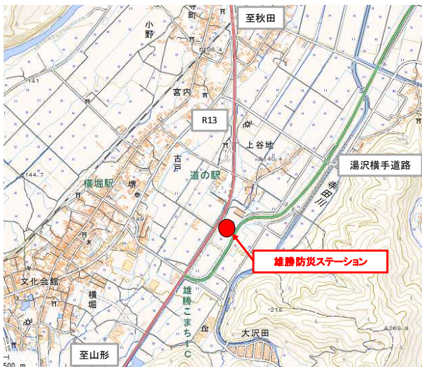
（取締り場所位置図）