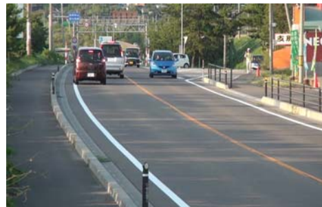
(右折車両と後続車錯綜状況)