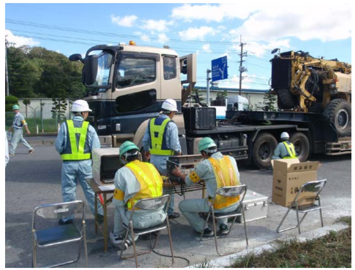
・特殊車両の寸法や重量の測定及び、通行許可証等の確認

〈 発表記者会： 宮城県政記者会、東北電力記者クラブ、東北専門記者会、大崎記者クラブ 〉