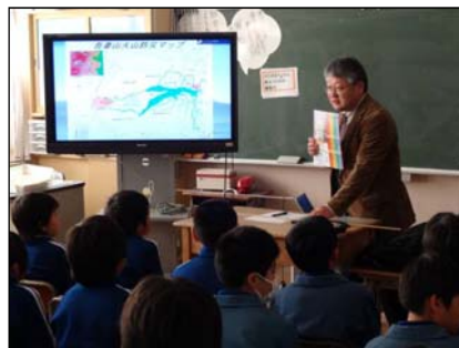
出前講座(庭塚小)の様子