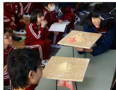
火山噴火の模擬実験(岡山小)の様子