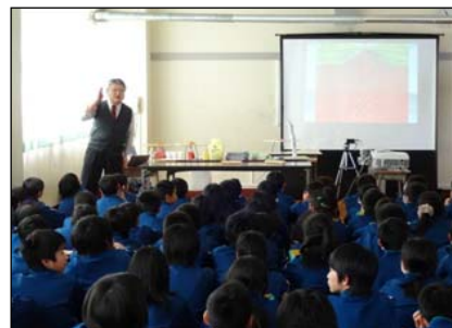
出前講座(笹谷小)の様子