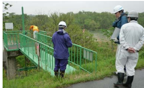
樋門点検実施風景