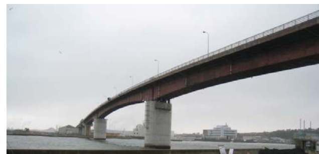
日和大橋 (石巻市雲雀野一丁目地先)