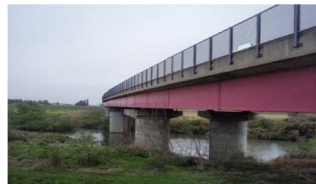
東北自動車道鳴瀬川橋梁 (大崎市三本木蟻ヶ袋地先)