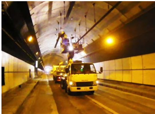
吊り金具撤去状況