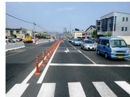
[文翔館西交差点から撮影]