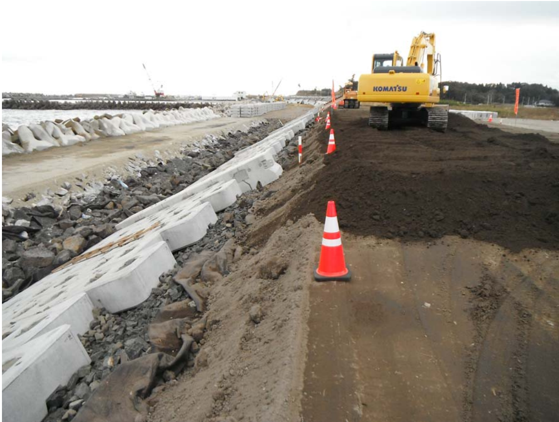
中浜工区復旧工事の施工状況: 11月11日