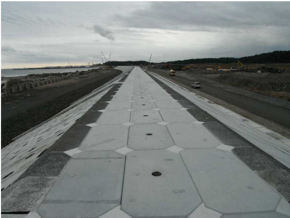
中浜工区復旧工事の完成状況: 11月11日