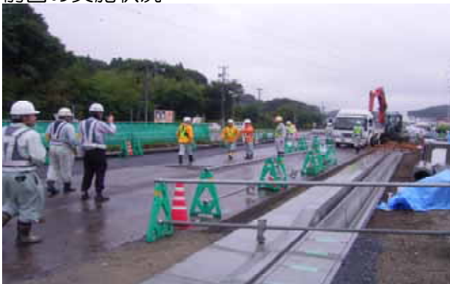
▲パトロールの様子