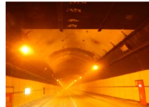
天井板撤去後の状況